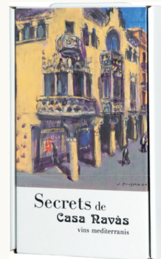
Caixa de cartró