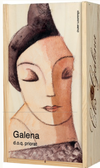
Caixa de fusta serigrafiada