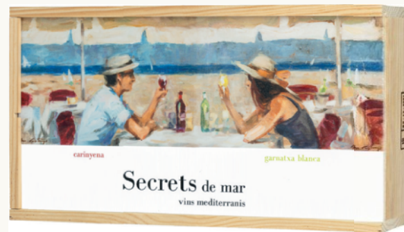
Caixa de fusta serigrafiada