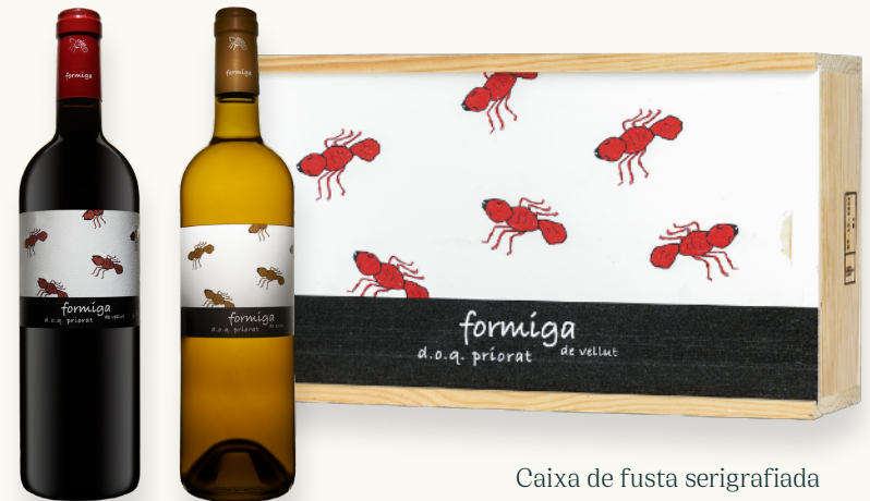
Caixa de fusta serigrafiada