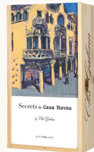
Caixa de fusta serigrafiada