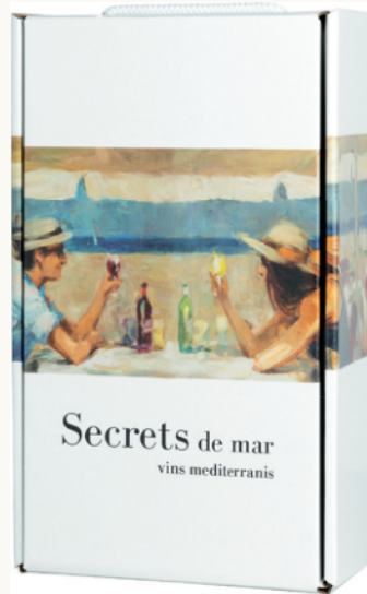
Caixa de cartró